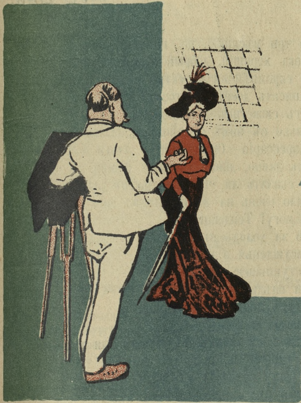
Фотографъ. Сударыня, а Вы К-Д или П-П-П. Она (иронически) А, Вы не гороховое пальто!...