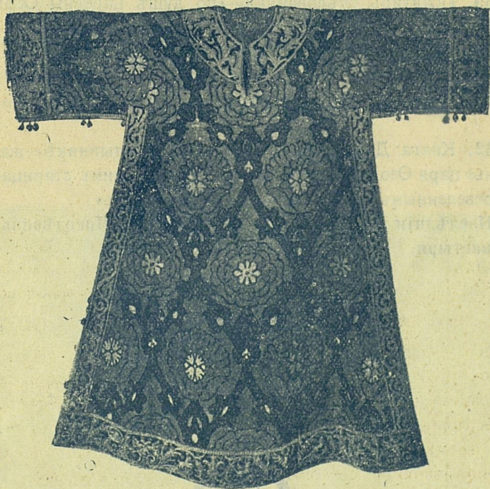
Саккосъ Патріарха Адріана изъ верхняго платья царя Алексѣя Михайловича. № 53,

53. Саккосъ патр. Адріана изъ золотнаго бархата на аксамитное дѣло; изящно низанъ кафимскимъ жемчугомъ; сдѣланъ изъ верхняго платья царя Алексѣя Михайловича въ 1691 году. Патріаршей Ризницы.