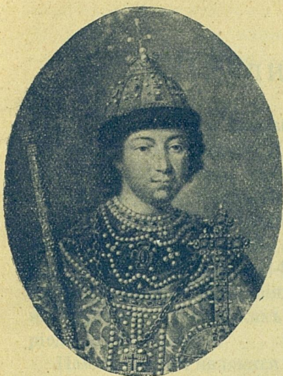
Царь и Великій Князь Михаиль Феодоровичъ всѣя Руси Самодержецъ.