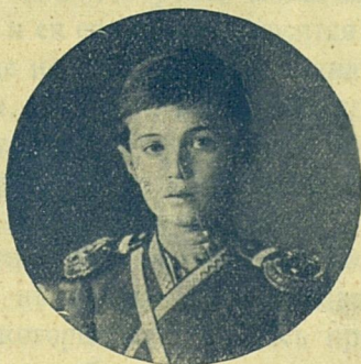
Его Императорское Высочество Государь Наслѣдникъ Цесаревичъ и Великій Князь Алексѣй Николаевичъ,