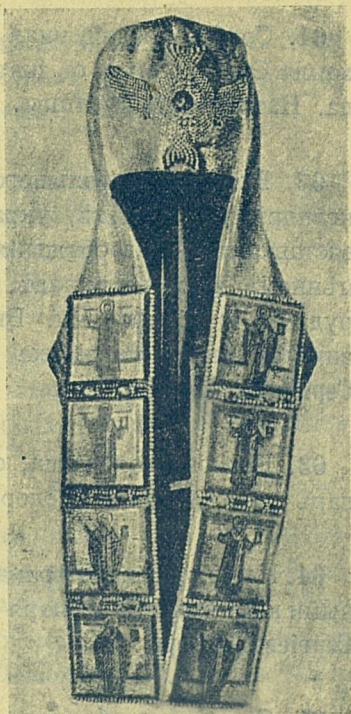
Клобукъ патриарха Филарета Никитича № 50.

«Въ понедѣльникъ пятая недѣли Великаго поста у Святѣйшаго патриарха Филарета Никитича Московскаго и вся Русіи кушенье было въ дѣревянныхъ хоромехъ; ѣствы подавали вареніе съ масломъ, капуста пареная съ орѣховымъ масломъ, грибки цѣлики безъ масла, грибки тяповые съ масломъ, горошекъ хлѣбанецъ, лапша гороховая» (листъ 410).