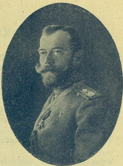
Его Императорское Величество Государь Императоръ Николай Александровичъ Самодержецъ Всероссійскій.